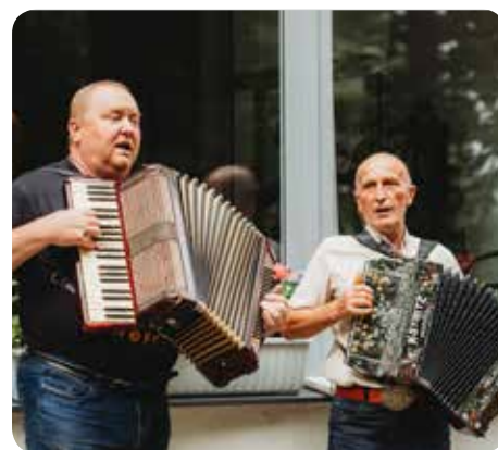
Posezení s harmonikou