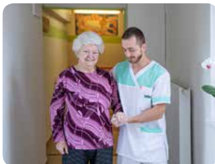
Procvičování motorických funkcí