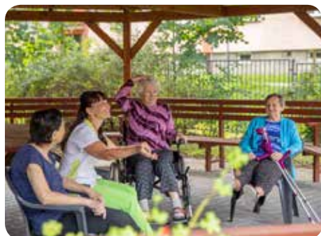
Odpočinek v altánku