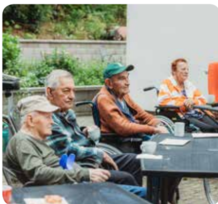
Posezení s harmonikou