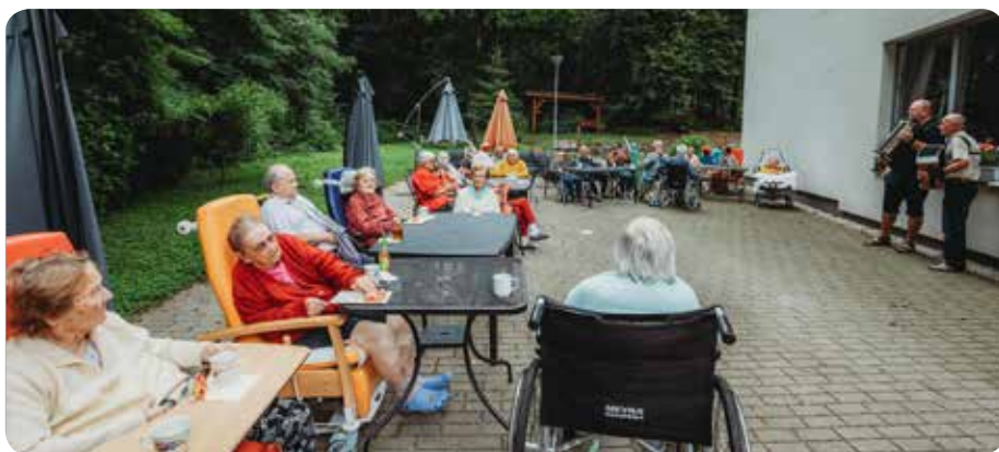
Posezení s harmonikou