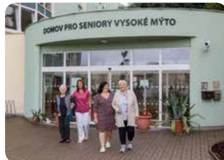
Jdeme na procházku