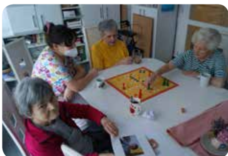
Člověče nezlob se