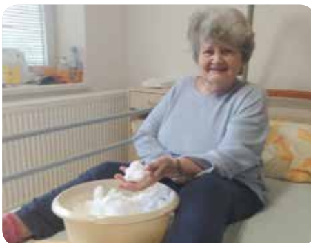
Sníh v dlaních