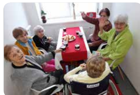
Posezení u kávička