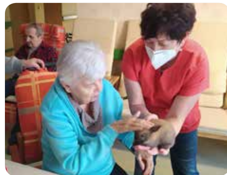
Přivítání nového obyvatele Domova