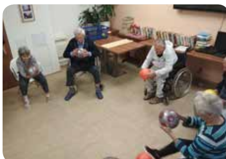
Pojďme si zacvičit!