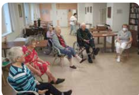
Pojďme si zacvičit!