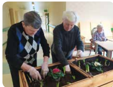
Sázení jarních cibulovin