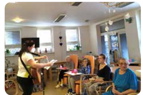
Zpívání s kytarou