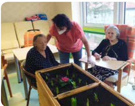
Sázení jarních cibulovin