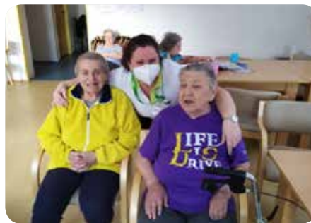
Nezapomínáme se smát