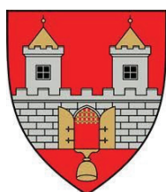
Týn nad Vltavou