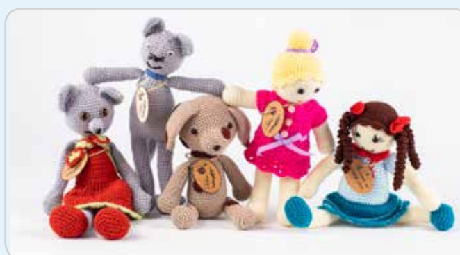
Hračky z Ledax ARTu