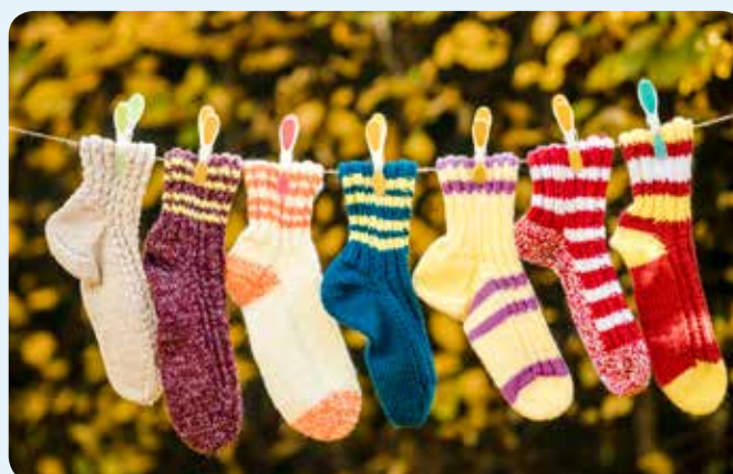
Ponožky z Ledax ARTu