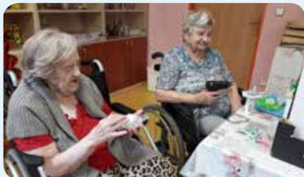
Výroba hrnečků na dušičky