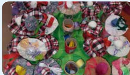
Hrnečky na dušičky pro děti