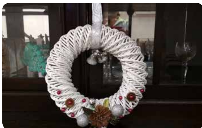
A advent může začít