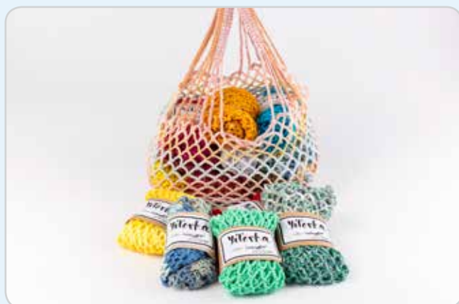
Síťovky z Ledax ARTu