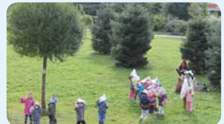
Vystoupení MŠ Pod smrkem POD OKNY