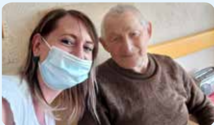
Aktivizace s úsměvem